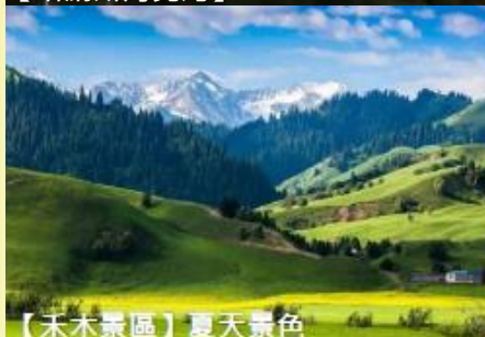
【禾木景區】夏天景色