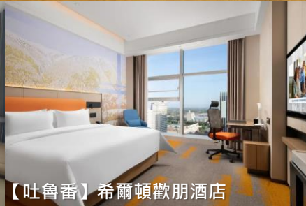
【吐魯番】希爾頓歡朋酒店