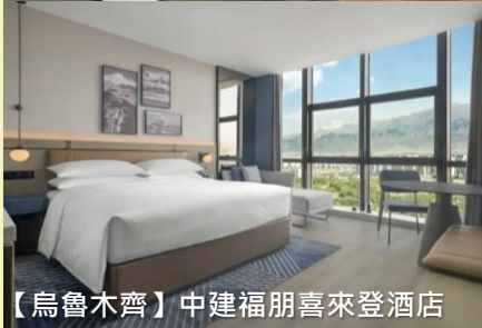
【烏魯木齊】中建福朋喜來登酒店