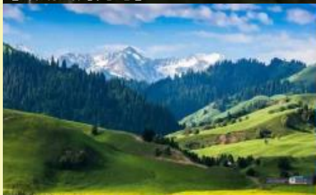
【禾木景區】夏天景色